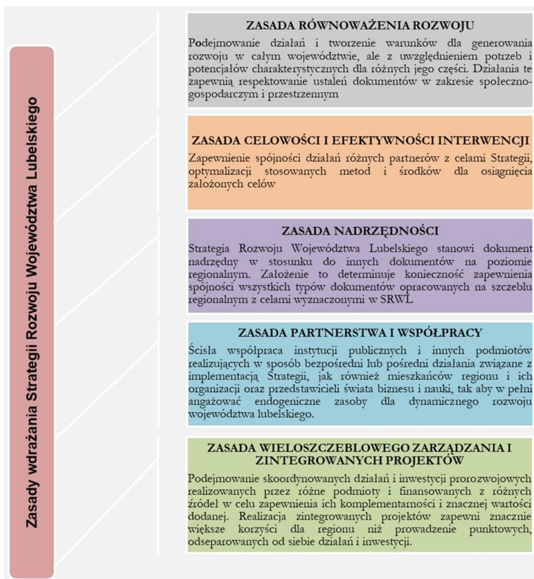
Rysunek 1. Schemat zasad wdrażania Strategii 2030